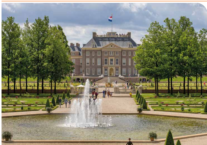
Prachtige tronen, zalen en pracht van weleer.